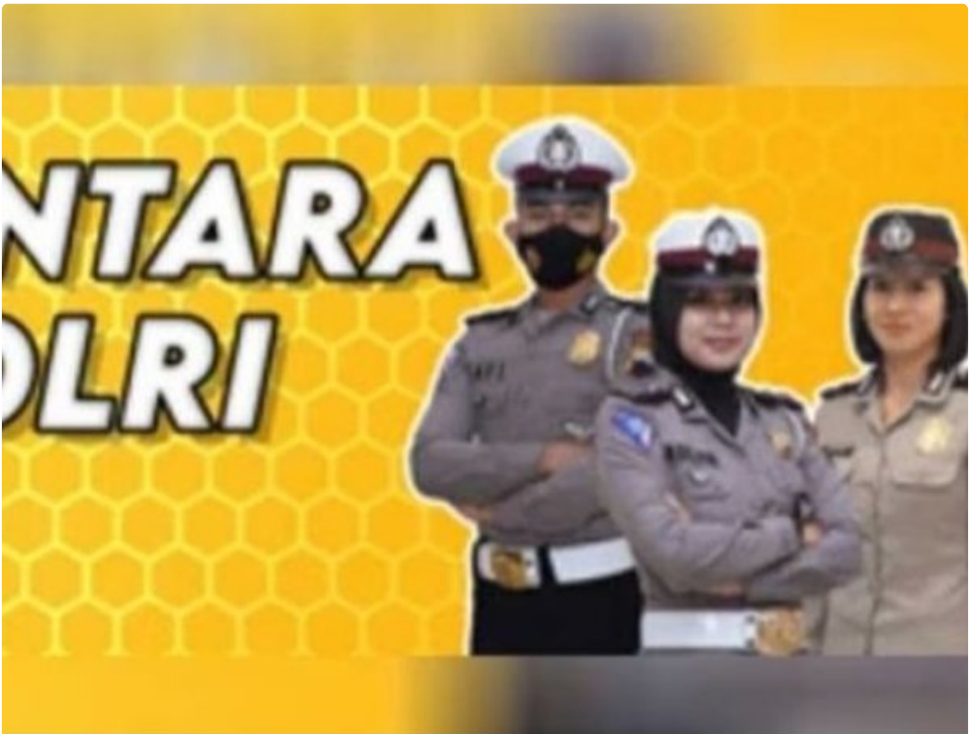
Penerimaan Polri Bakomsus

PALANGKA RAYA - Kesempatan terbuka bagi lulusan bidang pertanian, perikanan, peternakan, gizi, dan kesehatan masyarakat untuk bergabung menjadi anggota Polri melalui program penerimaan Bintara Kompetensi Khusus (Bakomsus).