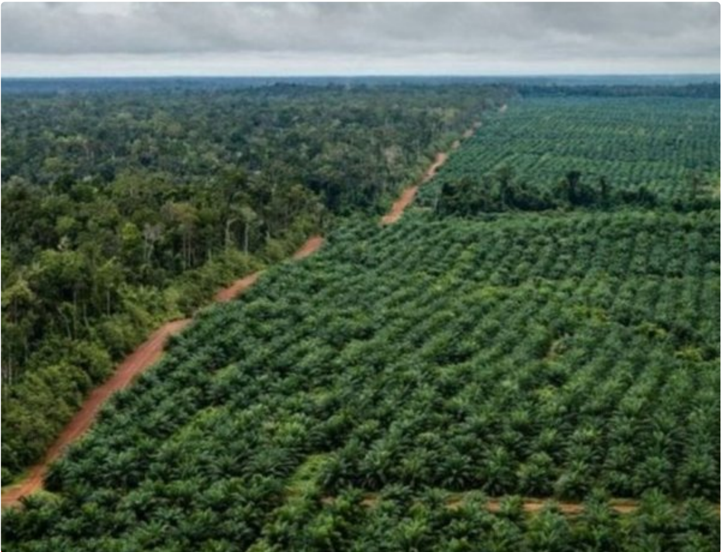
Gambar: Perkebunan Kelapa Sawit berbatasan dengan hutan

PALANGKA RAYA - Berikut daftar perusahaan pengelola kebun sawit dalam kawasan hutan yang diproses dan ditolak permohonannya oleh Kementerian Kehutanan RI: