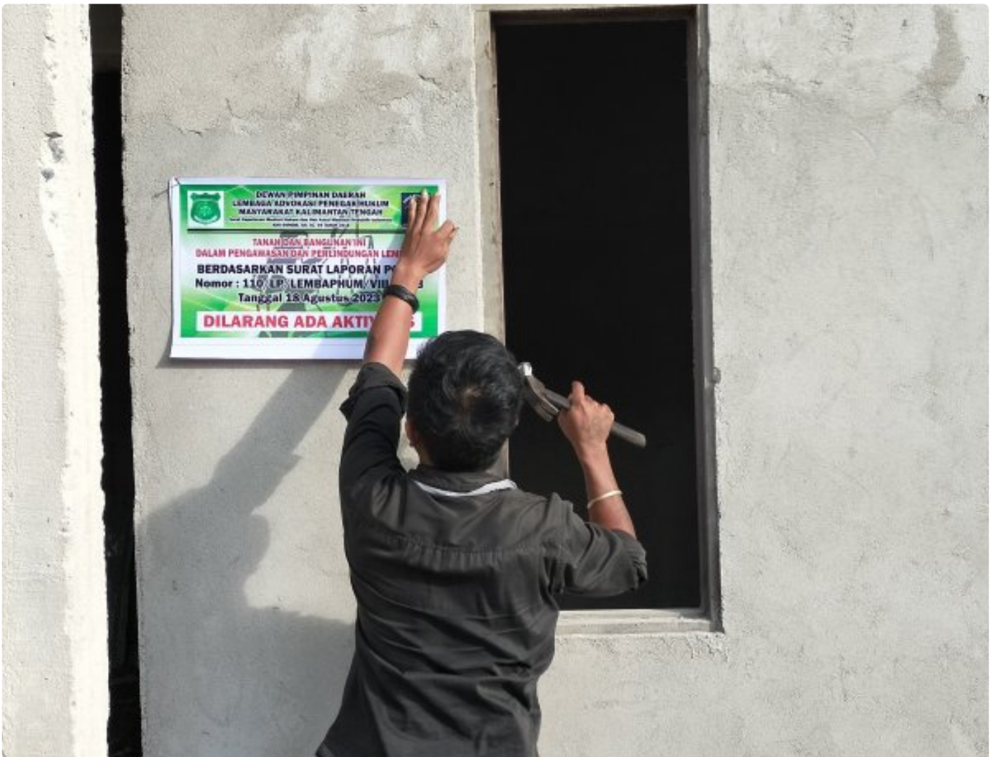
Gambar: Bangunan BTN Yang Dibangun Oknum D Di Segel Untuk Dilarang Ada Aktivitas Sementara

PALANGKA RAYA - Kasus Penyerobotan tanah dan diduga kuat penipuan oleh oknum berinisial D selaku diduga pemilik CV Graha Angga Mandiri (CV GAM) yang berkantor di Jalan Banteng 17 Palangka Raya, Kalimantan Tengah (Kalteng) ini resmi dilaporkan ke Pihak Kepolisian.